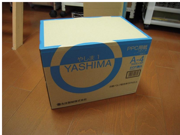
写真 3-5-a. やしま I の外装

また、紙を接合する場合、 セロテープを使ってはいけません 。セロテープは経年劣化が著しく、1年ほど経つとすぐに変色します。メンディングテープか、透明テープを使いましょう。(ビニールテープもダメです!)